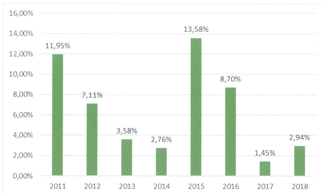
Grafiek 3: Kosten versus inkomsten ratio

Grafiek 2 laat de bestedingen aan projecten versus de inkomsten zien. We zien de inkomsten en de bestedingen aan de projecten het liefst zo dicht mogelijk elkaar liggen, aangezien dat aangeeft hoe wij de inkomsten zoveel mogelijk kunnen besteden aan onze projecten zonder hoge overheadkosten.