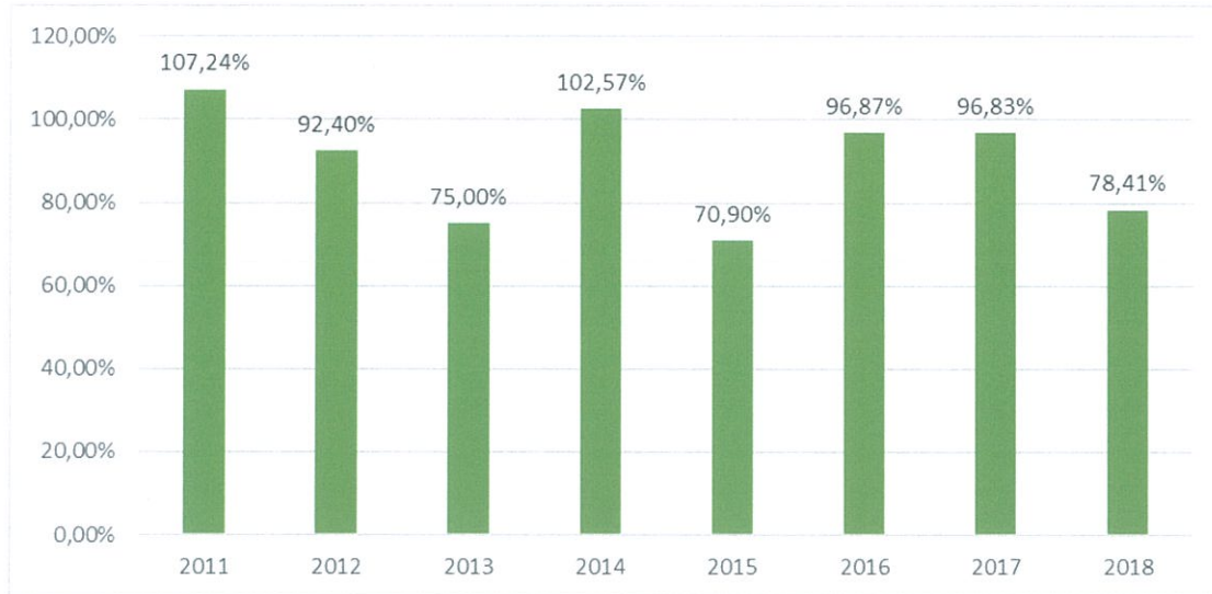
Grafiek 2: Bestedingen versus inkomstenratio

Grafiek 2 laat de bestedingen aan projecten versus de inkomsten zien. We zien de inkomsten en de bestedingen aan de projecten het liefst zo dicht mogelijk elkaar liggen, aangezien dat aangeeft hoe wij de inkomsten zoveel mogelijk kunnen besteden aan onze projecten zonder hoge overheadkosten.