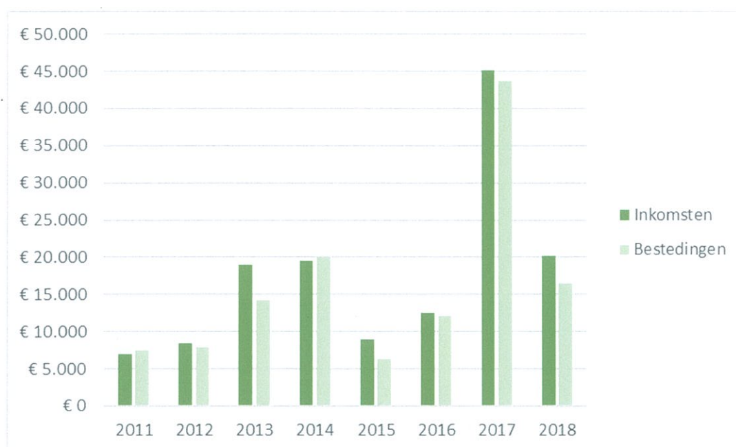
Grafiek 1: Inkomsten versus bestedingen

Grafiek 1 geeft de absolute inkomsten versus de bestedingen weer. De daling in 2015 is toe te kennen aan de Ebola crisis waarbij de aandacht van donateurs is verschoven naar acute steun en de wereldwijde financiële crisis. 2017 is de uitschieter door de komst van het brandwondencentrum in Mariama Kunda. In 2018 hebben wij het inkomstenniveau van voor 2014 weer mogen overschreden.